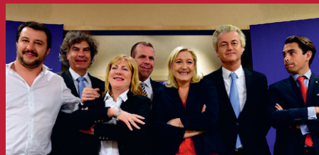
Marine le Pen en compagnie des chefs de délégation du Groupe ENL